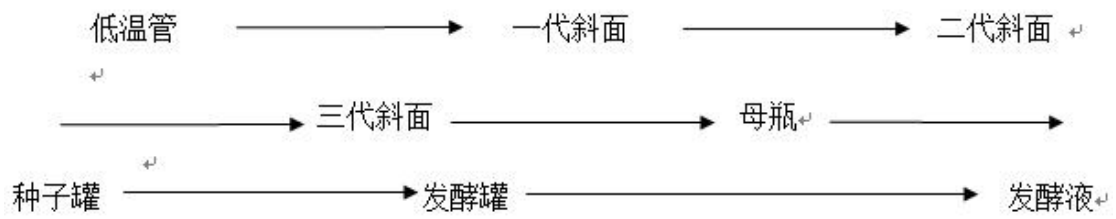
图1. 发酵工艺流程图